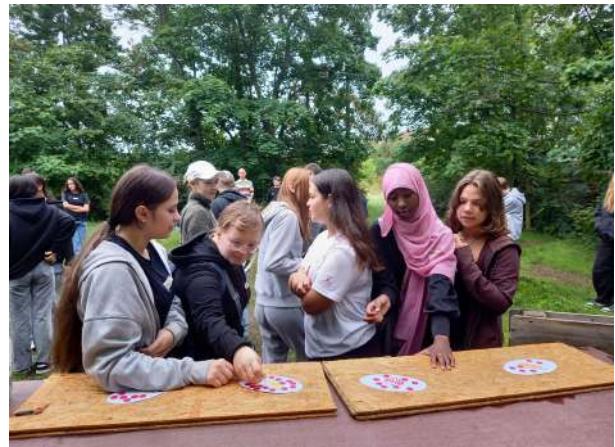
Ein bewegtes Quiz zum Thema Lebensmittel mit den Naturfreunde