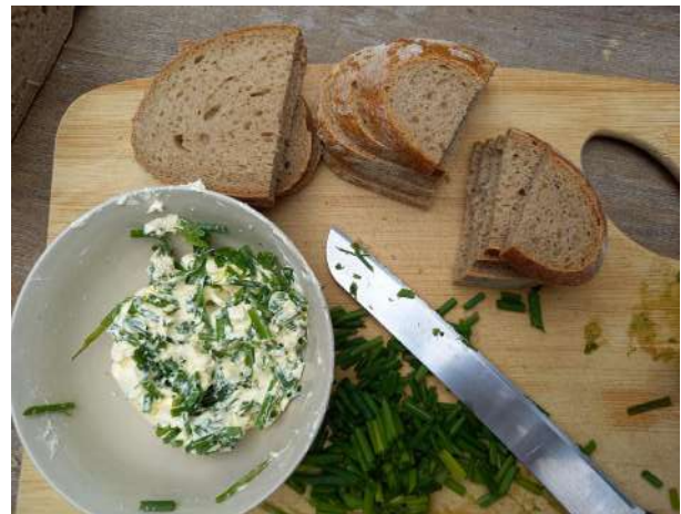
Das "gerettete Brot" mit Kräuterbutter schmeckte lecker!

Es war wirklich toll, sich so intensiv mit einem Thema zu beschäftigen. Und ganz viele kreative Kurzfilme sind in allen Obergruppen entstanden. Ein kleines Filmfestival wird es im Dezember noch geben. Dann wollen wir uns gemeinsam die besten Filme ansehen und feiern. Wir danken unseren Partnern in den Betrieben, dass sie uns ihre Arbeitswelt mit so viel Herz gezeigt haben. Ein herzliches Dankeschön